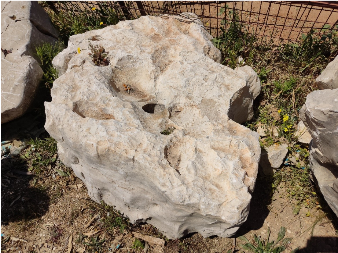
Εικόνα 2 βάση/ φυσική πέτρα

Η βάση του μνημείου θα είναι ένας όγκος ακανόνιστου σχήματος από φυσική ανεπεξέργαστη πέτρα γενικών διαστάσεων 1,00μ x 1,00μ και μέγιστου ύψους 0,50μ, όπου πάνω της θα τοποθετηθούν με βλήτρα δύο στήλες, από λευκό μάρμαρο Καβάλας, πάχους 9εκ. Συνολικό ύψος μνημείου 1,70μ.