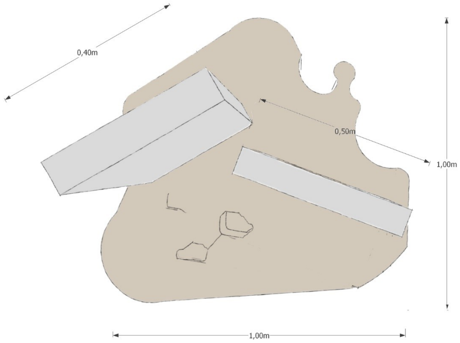
Εικόνα 6 κάτοψη μνημείου