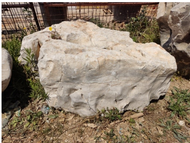
Εικόνα 3 βάση/ φυσική πέτρα μάρμαρο Καβάλας