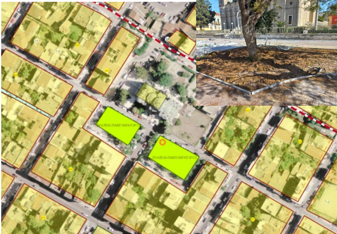
Εικόνα 1 χωροθέτηση μνημείου επί της πλατείας

Η πλατεία Παντοκράτορος βρίσκεται εντός του Ιστορικού Κέντρου Πατρών (παλιό σχέδιο) στην περιοχή του Ρωμαϊκού Ωδείου. Η προτεινόμενη θέση για την τοποθέτησή του είναι αυτή που σημειώνεται στην παραπάνω εικόνα, στην βορειοδυτική γωνία του ανατολικού τμήματος της πλατείας Παντοκράτορος, τμήμα που συνορεύει με το ΟΤ 437 (η πλατεία χωρίζεται από την οδό Ηλείας).